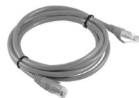
2 Cable Ethernet