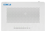
1 Router wifi