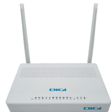
1 Router wifi