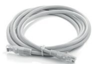
2 Cable Ethernet