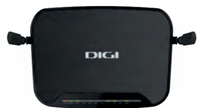
1 Router wifi