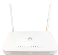
1 Router WIFI