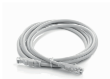
2 Cable Ethernet