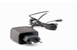
3 Alimentador de corriente