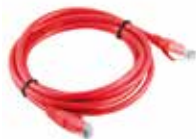
2 Cable Ethernet (Rojo)