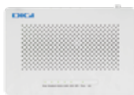
1 Router Wi-Fi